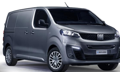
5DN - GRAU ARTENSE