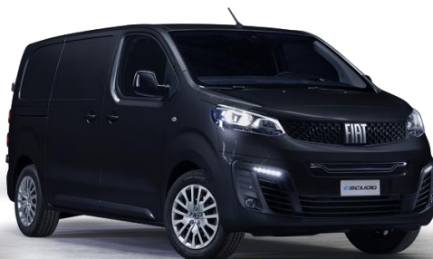
5DP - SCHWARZ PERLA