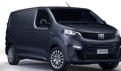
6FW - GRAU PLATIN