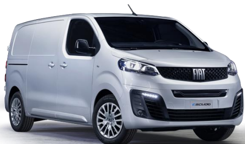
5DM - WEISS