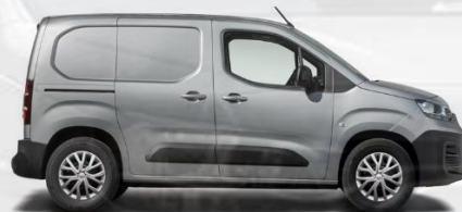
5DN - GRAU ARTENSE