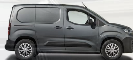
6FW - GRAU PLATIN