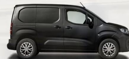
5DP - SCHWARZ PERLA