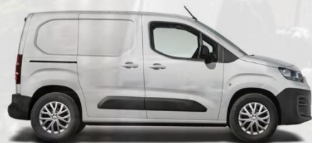
5DM - WEISS