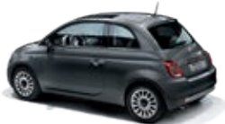
695 Pompei Grau