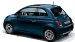
687 Dipinto di blu Blau