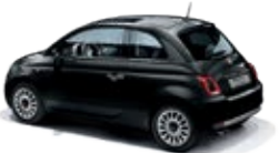
876 Vesuvio Schwarz