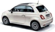
268 Gelato Weiss