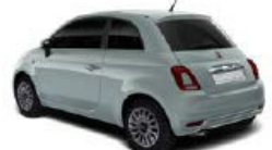
196 Rugiada Grün